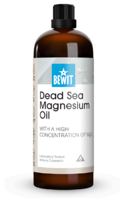
Dead Sea Magnesium Oil