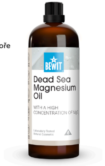
Dead Sea Magnesium Oil